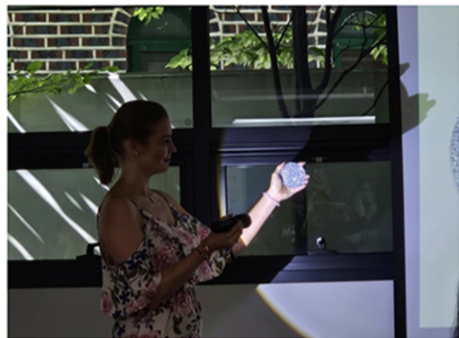
다이아몬드보다 더 빛나 미국에서는 ‘선사인 엘리먼트’라고도 불리는 오스뮴.