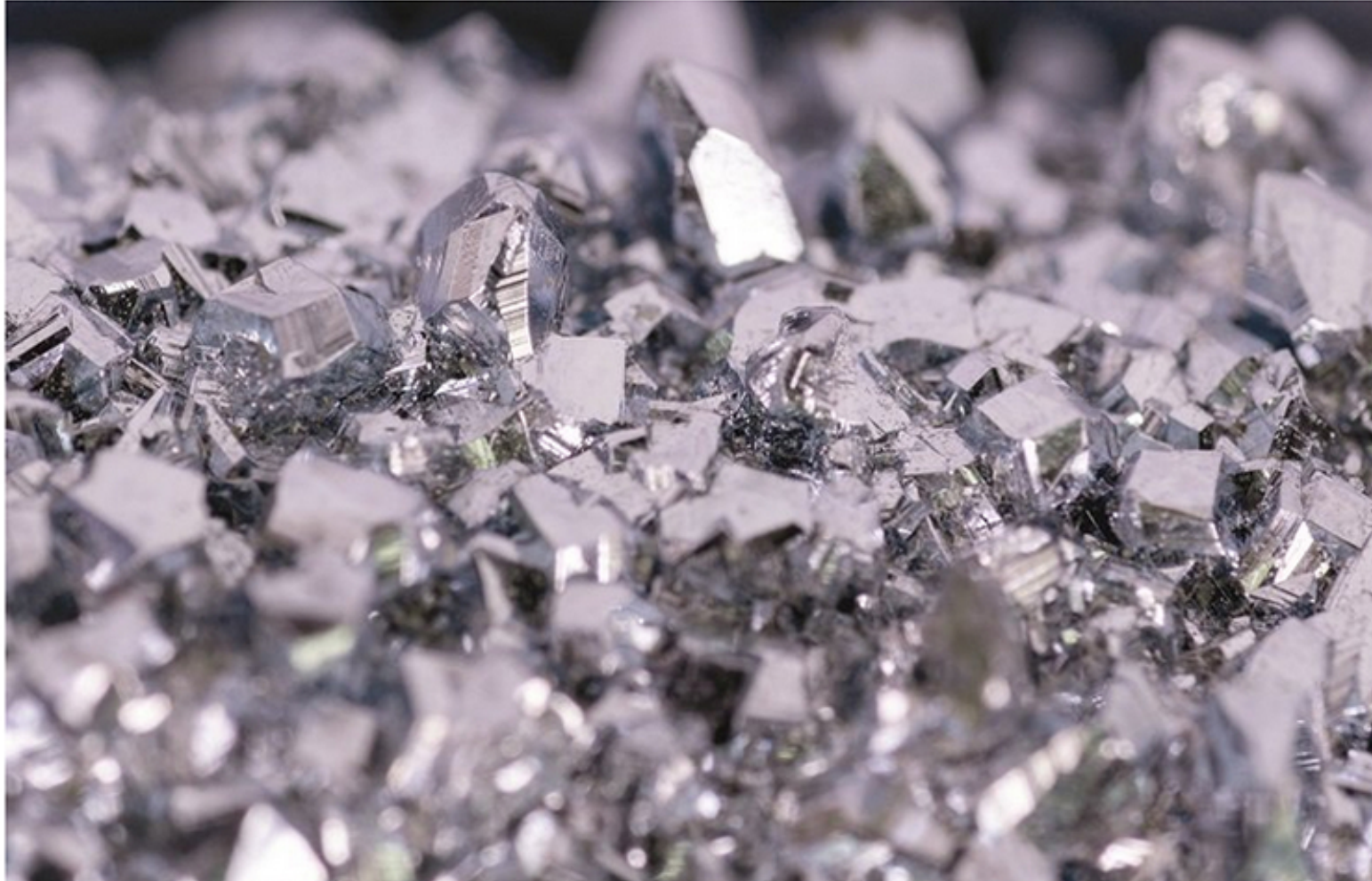
Osmium-Institut zur Inverkehrbringung und Zertifizierung von Osmium GmbH

Lange Zeit war Gold das Edelmetall der Wahl in aller Welt. Doch mit Osmium, dem letzten und zugleich seltensten Edelmetall, gibt es nun einen ernst zu nehmenden Herausforderer. Vor allem seine Seltenheit und das absehbare Ende der Produktion machen Osmium als ebenso solide wie rentable Sachwertanlage interessant.