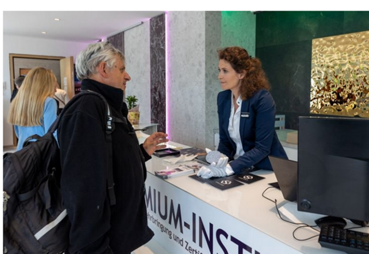
Im Osmium-Institut zur Inverkehrbringung und Zertifizierung von Osmium GmbH ist professionelle Beratung selbstverständlich

Wer noch mehr über das seltene Edelmetall und den Gold-Herausforderer Osmium erfahren möchte, sollte eine Kurzreise nach Süddeutschland einplanen – oder vielleicht auf der Durchfahrt nach Süden einen kurzen Renditehalt einlegen: Die jüngste Eröffnung des neuen Hauptquartiers des internationalen Osmium-Instituts in Murnau am Staffelsee markiert einen bedeutenden Meilenstein in der Erfolgsgeschichte des Edelmetalls. Die 560 Quadratmeter große Anlage beherbergt nicht nur hochmoderne Laborräume und Tresoranlagen, sondern auch einen Flagship-Store. Diese Einrichtung dient als "gläsernes Labor", das es der Öffentlichkeit erlaubt, die Prozesse der Edelmetallverarbeitung hautnah zu erleben. Es gibt vor Ort auch Führungen und Vortrräge, die durch das örtliche Fremdenverkehrsamt Murnau buchbar sind.