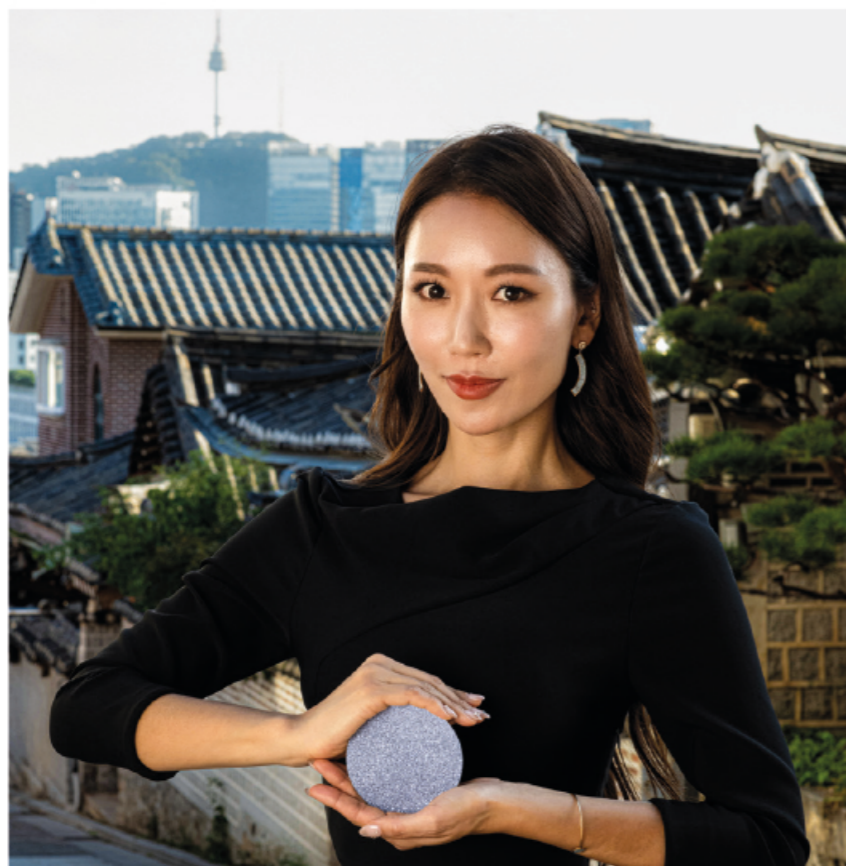
Die Expansion nach Asien markiert einen bedeutenden Schritt bei der Etablierung kristallinen Osmiums im Schmuck- und Kunstmarkt sowie als Sachwertanlage und Ergänzung zum Diamantheandel. The expansion into Asia represents a major step in establishing crystalline osmium in the jewelry and art markets, as well as positioning it as an asset investment and a complement to the diamond trade.

Die Messepräsenz auf der Jewelry Fair 2024 in Hongkong oder eine Pressekonferenz in Seoul mit Osmium-Testimonial Alexander Bublik, ATP-Tennispieler, erregen Aufsehen in Asien.